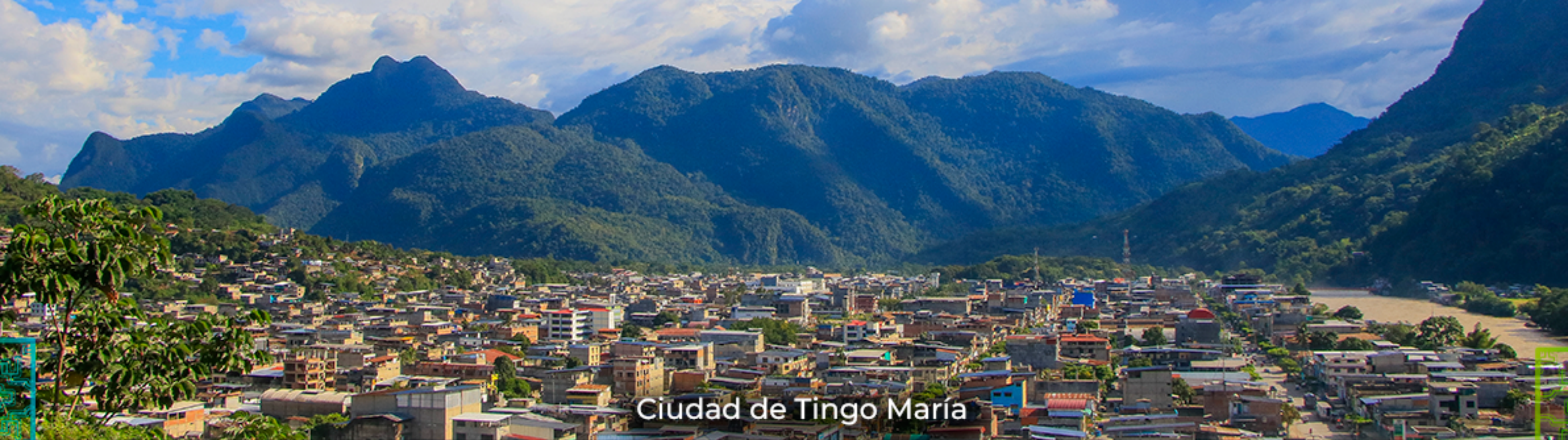
Ciudad de Tingo María